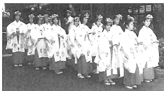
お神輿と一緒に氏子町会を回ります